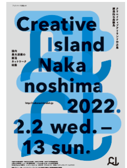
クリエイティブアイランド 中之島リーフレット