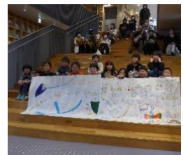
こども本の森・中之島 × 当協議会のイベント