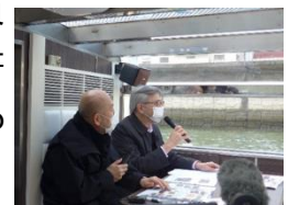
大阪中之島美術館× 当協議会のイベント