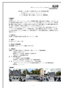
キックオフミーティング開催