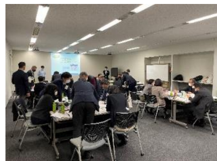
第1回防災勉強会・KUG 実施状況