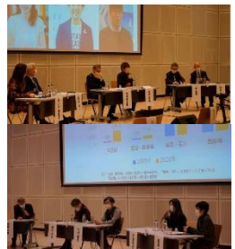
シンボルシンポジウム