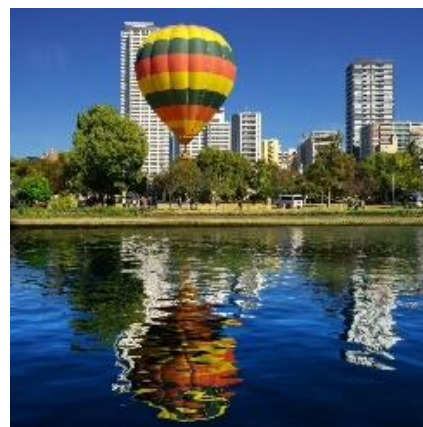
[最優秀作品] 作品名:川面に映えて